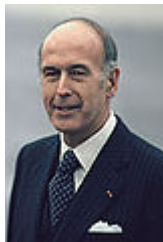
Valéry Giscard d'Estaing