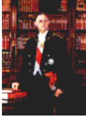
Charles de Gaulle

Представьте, что Вы – журналист-обозреватель. Вам поручено подготовить небольшую статью на основе предоставленных аналитиками графических данных. Напишите статью объемом не менее 200 слов по обозначенной проблеме. Не забудьте предложить заголовок.